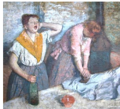
Edgar Degas - Les repasseuses

Les fers à repasser étaient des objets en fonte très lourds munis d'une poignée. Les femmes les posaient sur le feu pour les faire chauffer et utilisaient de l'eau pour défroisser le linge. Avec l'évolution de la technologie, les fers chauffent seuls grâce à un système électrique et ont une réserve d'eau intégrée à l'appareil pour produire de la vapeur. Les repasseuses utilisaient des fers très lourds et peinaient de longues heures pour obtenir un linge parfaitement repassé. Les fers sont beaucoup plus légers et fonctionnels ce qui rend le travail de l'utilisateur moins pénible et plus rapide. Avec l'arrivée des commandes numériques, on verra sans doute apparaître des fers d'une nouvelle génération. Sauront-ils repasser sans intervention humaine ?