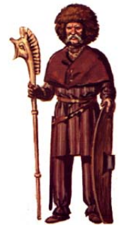
Gaulois tenant un carnix (sorte de trompette)

Un bouclier et un casque décoré de cornes ou d'ailes d'oiseau servent de protections.