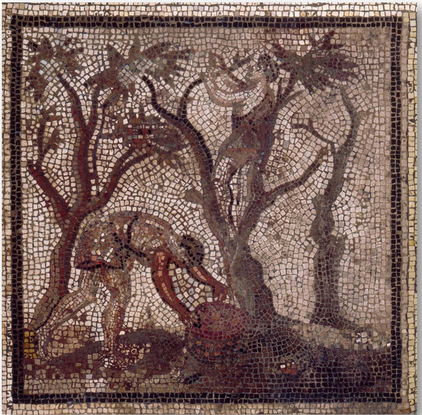
La mosaïque de Saint-Romain-en-Gal