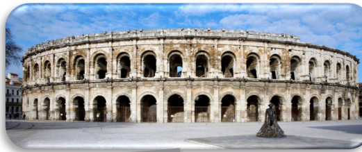
Les arènes de Nîmes Architecture romaine

L'art grec classique a fortement inspiré l'art de l'Empire romain. Cet art est considéré comme la référence absolue en sculpture, peinture, architecture, dessin pendant des milliers d'années.