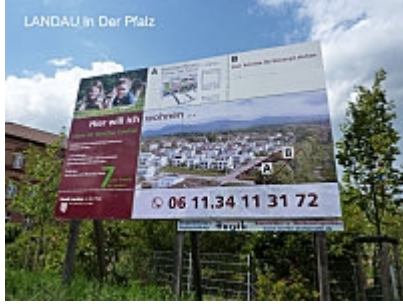
Les carrés A et B Caserne?

de LANDAU. Visite de la ville et j'essaye de retrouver les bâtiments de mon ancien Régiment (8ème RIM) Voilà ? J'étais au bon endroit ! Grâce à un Allemand cheveu gris : « ja, hier gab es eine Französisch Garnison » oui, ici il y avait une garnison militaire française. Lui à cette époque il était en garnison à BREST ?