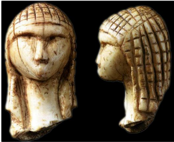
La Dame de Brassempouy -