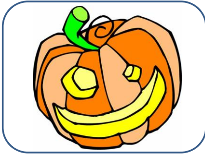
CITROUILLE citrouille citrouille