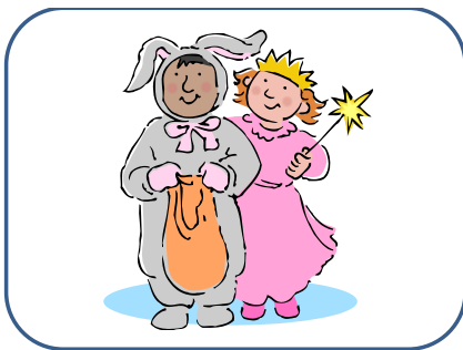
DÉGUISEMENTS déguisements déguisements