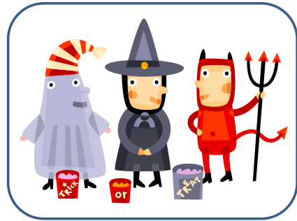
DÉGUISEMENTS déguisements déguisements