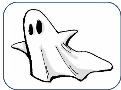
FANTÔME fantôme fantôme