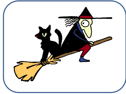
SORCIÈRE sorcière sorcière