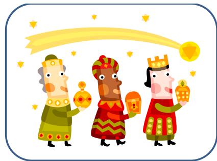
ROI MAGES rois mages rois mages