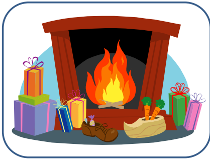
CHEMINÉE cheminée cheminée