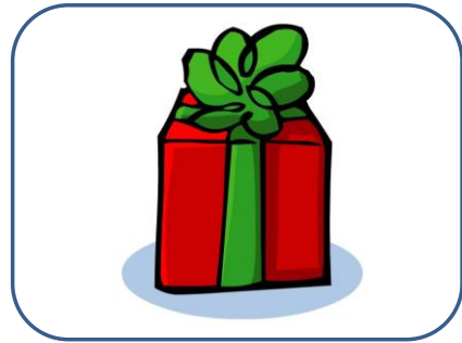
CADEAU cadeau cadeau