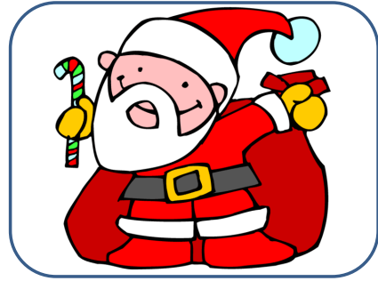
PÈRE NOËL Père Noël Père Noël