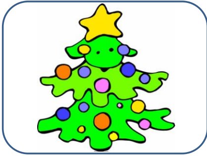
SAPIN sapin sapin