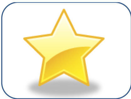
ÉTOILE étoile étoile