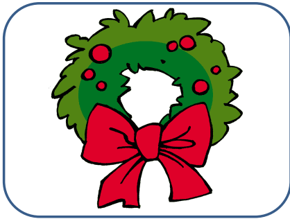
COURONNE couronne couronne