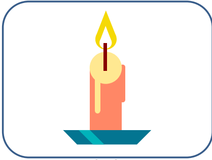
BOUGIE bougie bougie