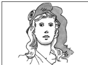
Doc 3 : Le buste de Marianne