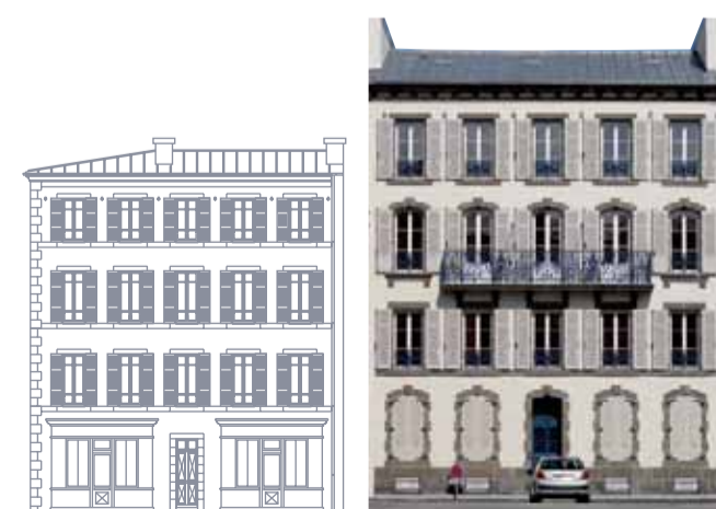
immeuble à faible ornementation 1889

Ils forment le tissu de la ville en dehors de Siam. Le modèle de base est d'une grande simplicité : murs en moellons, encadrement de baie en granit, volets persiennés, le tout selon une composition rigoureuse. Les quartiers anciens de Brest doivent leur caractère à ces immeubles que l'on rencontre surtout à Saint-Martin, Keruscun et Recouvrance.