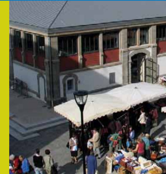
Les Halles - Architecte Jean-Jacques Morvan

Avec ses maisons typiques au toit de zinc et aux persiennes en bois, ses rues pleines de charme, ses commerces et sa vie de village dans la ville, Saint-Martin est un quartier auquel sont fortement attachés les 6000 Brestois qui y vivent ou y travaillent. On y recense plus de 600 immeubles représentant 4300 logements, ainsi que 550 locaux commerciaux ou professionnels.