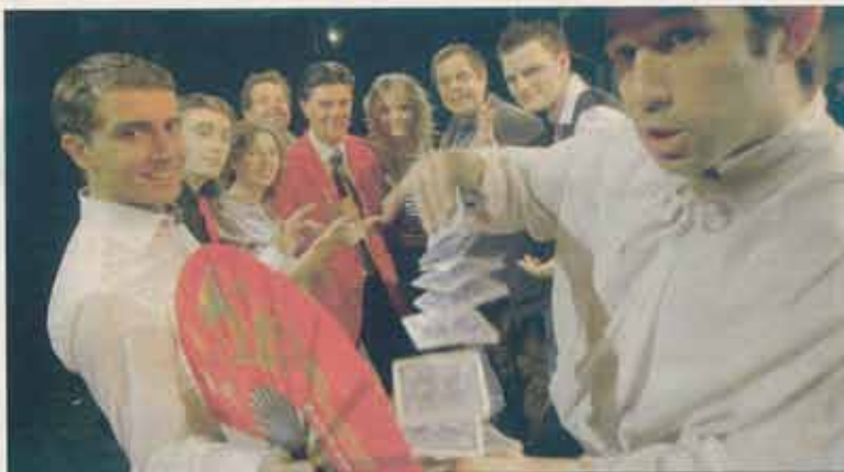
Ouverture hier après-midi au Palais des congrès d'Antibes Juan-les-Pins du 19 e Festival de la Colombe d'Or.

Ce festival pas comme les autres, mélange deux forces : le côté obscur (la foire au truc) et l'illusion des spectacles populaires. L'objectif : aller encore plus loin dans l'invention en utilisant toutes les technologies nouvelles pour séduire et faire rêver le public. Certains trucs, utilisent même le WiFi pour fonctionner. C'est étonnant, surprenant et réaliste. Ce soir encore, vous pourrez dé-