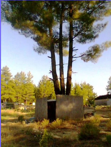
Douches au pied du Grand Pin - Evacuation de l'eau vers les plantations en aval-

Ces toilettes sèches en bois et bambou peuvent être utilisées « a la turque » ou a l'occidentale – papier toilette ou/et eau - Elles ne consomment pas d'eau potable – la sciure permet de faire un compost qui enrichira la Terre.