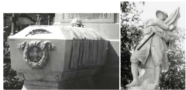
Monuments aux morts de Plessé et Châteaubriant

Quand il est déployé et brandit, il est signe de victoire.