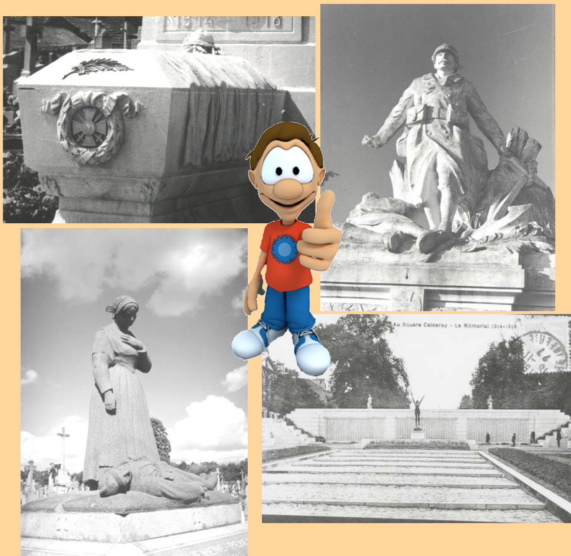
De gauche à droite : monuments aux morts des communes de Plessé, Montoir-de-Bretagne, Guéméné-Penfao et Nantes.