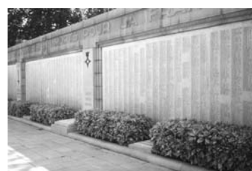
Tables mémoriales à Nantes