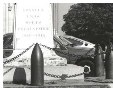
Monument aux morts de la Chevrolière