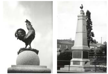
Monument aux morts de Saint-Etienne-de-Montluc

-Les animaux domestiques, plus rarement représentés sur les monuments, illustrent la vie quotidienne des soldats ou la paix retrouvée.