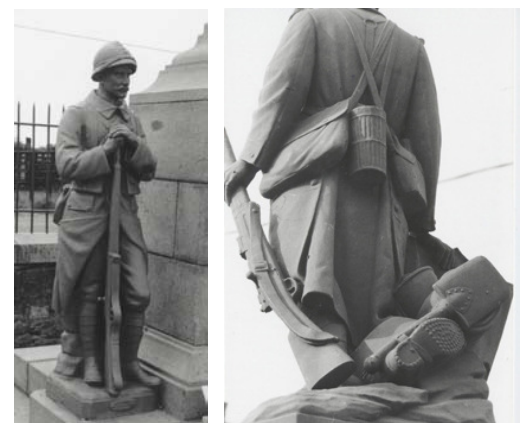
Monuments aux morts de Notre-Dame des Landes et de la Meilleraye de Bretagne

Des objets, tels que les casques, médailles, armes, fils barbelés, masque à gaz, etc. , nous rappellent l'horreur de la guerre.