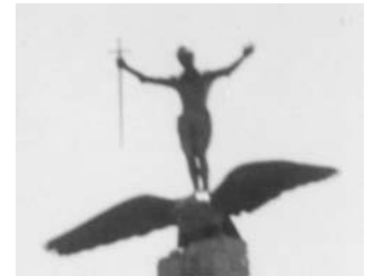
Monument des Américains à Saint-Nazaire