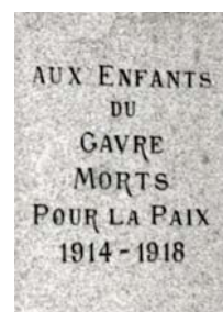
Monument aux morts du Gâvre