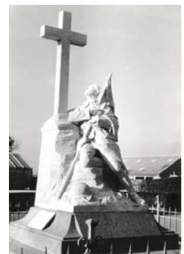
Monument aux morts de Casson

La croix associée dans notre pays à la religion chrétienne est devenue le symbole de la mort (une croix devant un nom signifie que la personne est décédée). On retrouve assez fréquemment des croix « chrétiennes » sur les monuments bien qu'une loi, votée en 1905, interdise tous signes religieux sur les monuments publics.