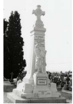
Monument aux morts de la Chapelle Basse-Mer

C'est le plus ancien monument érigé à caractère funéraire. Sa forme tend à rapprocher le défunt vers le ciel. Les pierres levées sont des hymnes à la vie.