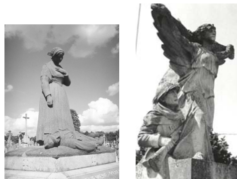
Monuments aux morts de Guemémé-Penfao et Paimboeuf

-Un obus enchaîné ne peut plus servir à faire la guerre. On peut y voir le symbole de la paix retrouvée.