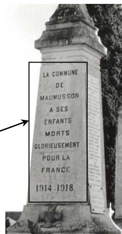
Monument aux morts de Maumusson

-et le sacrifice des morts : « à ses martyrs ».