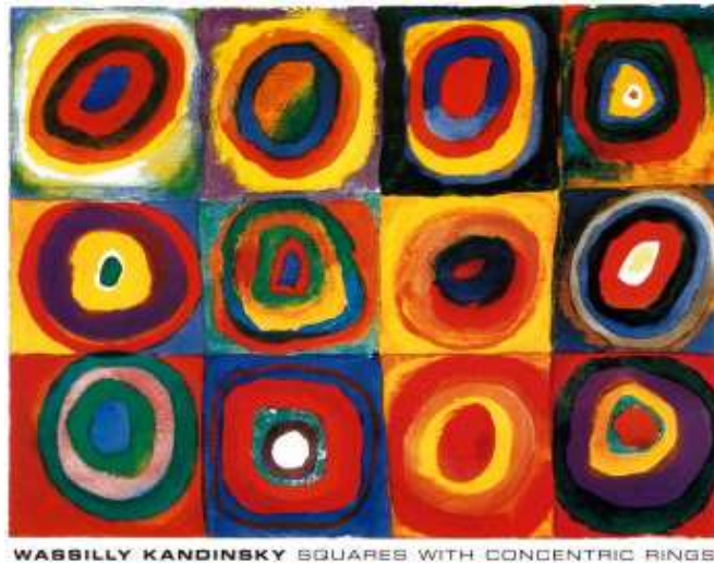
Tableau de référence : Wassily Kandinsky