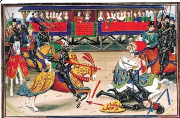
Enluminure du XIV ème siècle