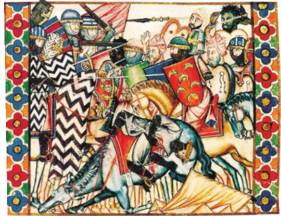
La reconquête chrétienne en Espagne, enluminure du XIII ème