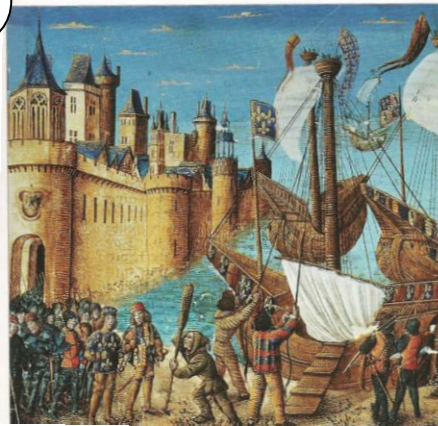
Embarquement de saint Louis pour la 7 ème croisade, Aigues-Mortes (1248), miniature du XV ème siècle.