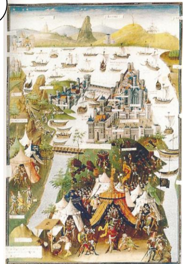
Constantinople assiégée par les Turcs en 1453 (enluminure)