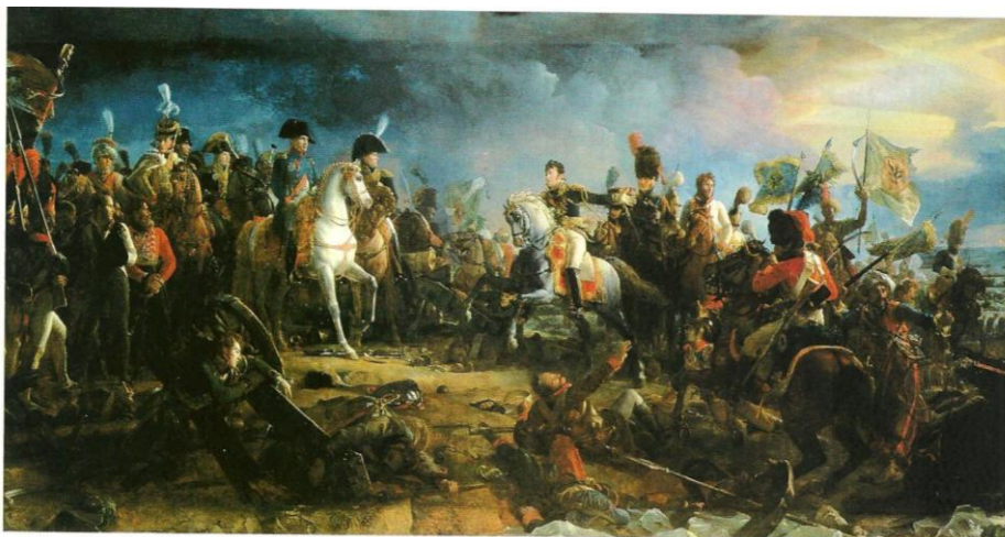
La bataille d'Austerlitz le 2 décembre 1805, François Gérard 1810