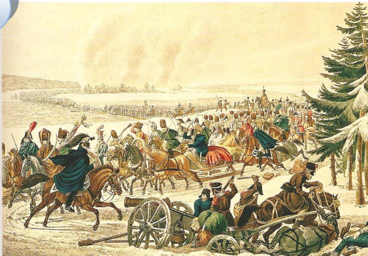
Le passage de la Berezina lors de la retraite de Russie en 1812, musée de Rouen.