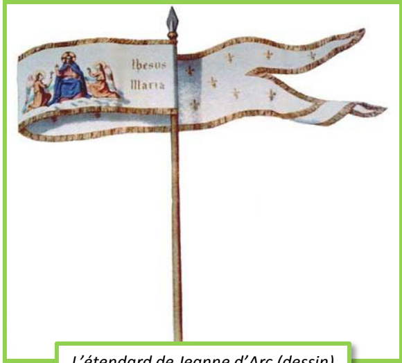
L'étendard de Jeanne d'Arc (dessin)

Amuse-toi à reproduire l'étendard de Jeanne d'Arc sur le quadrillage.