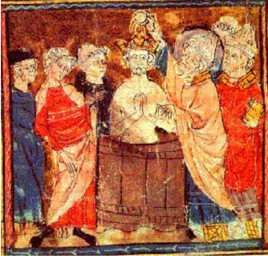
Enluminure du XIVème siècle

Selon la légende, c'est au cours de cette bataille difficile que le roi des Francs aurait imploré le secours du Dieu de Clotilde et pris la résolution de se convertir. Il passe à l'acte deux ans plus tard, le jour de Noël.