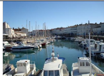
10 - Saint-Martin-de-Ré, Charente Maritime (POITOU-CHARENTES)