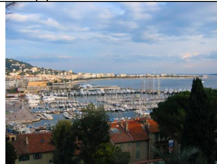
8 - Cannes, Alpes Maritimes (PACA)