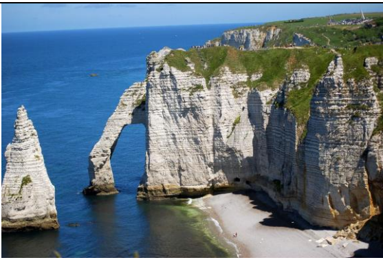
1 - Falaises d'Étretat, Seine-Maritime (HAUTE-NORMANDIE)