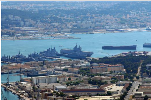
9 - Toulon, Var (PACA)