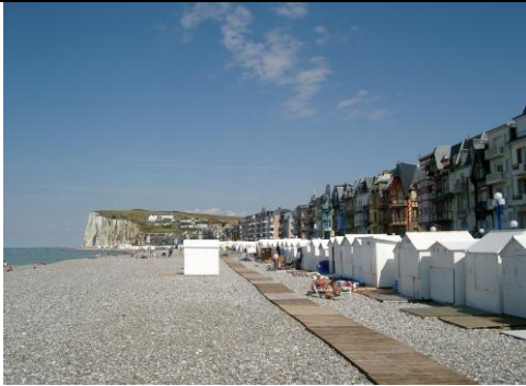
3 - Plage de la côte picarde sur la Manche (NORD-PAS-DE-CALAIS)