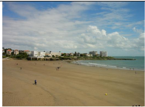
2 - Plage de Royan, Charente-Maritime (POITOU-CHARENTES)