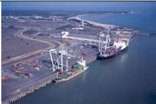
7 - Port de Bordeaux, Gironde (AQUITAINE)