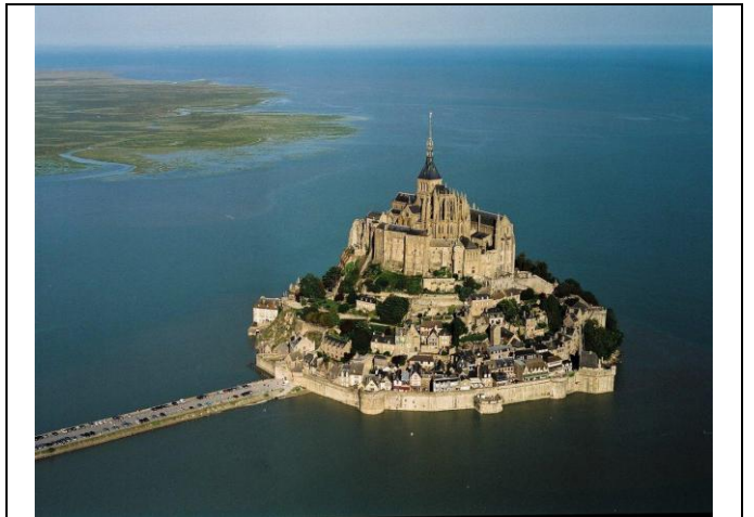
Le Mont Saint Michel, vue aérienne, de jour

« Le paysage est la portion d'espace que nos yeux peuvent voir. Il est le résultat, à la fois de données naturelles comme le relief, le climat, les roches, la végétation, et de l'intervention de l'homme au cours de l'histoire (agriculture, habitat, industrie, tourisme). On parle alors paysage montagnard, rural, mais aussi urbain, côtier ou industriel. »