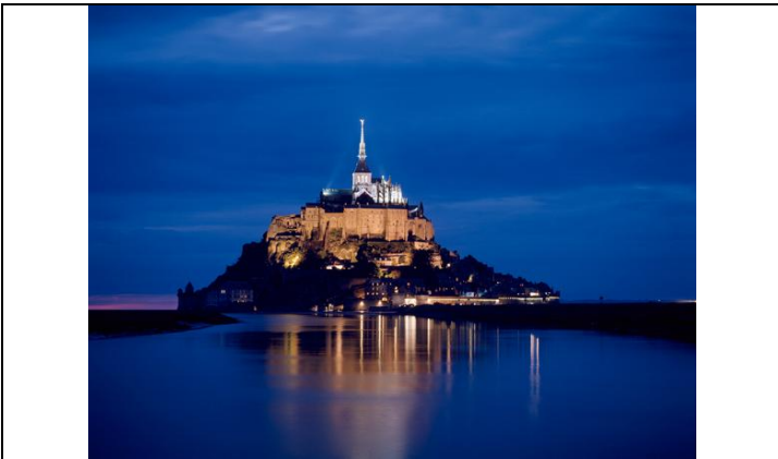
Le Mont Saint Michel, de nos jours, vue nocturne, de face