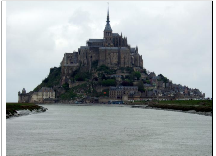
Le Mont Saint Michel, de nos jours, vue de jour, de face