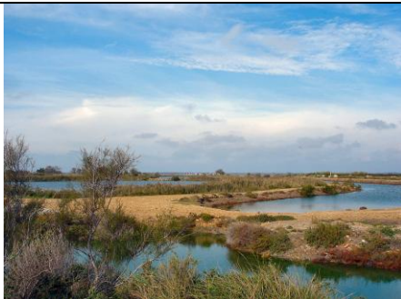
5 - La Camargue en automne