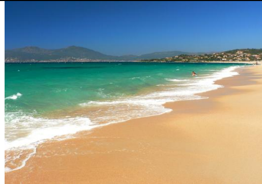
4 - Plage d'Agosta (CORSE)