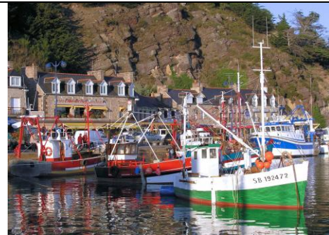
6 - Erquy, Côtes d'Armor (BRETAGNE)