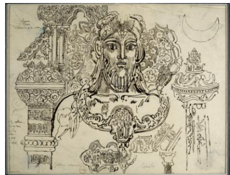
Tête de Jupiter sur fond ornementé Plume et encre noire, mine de plomb sur papier calque