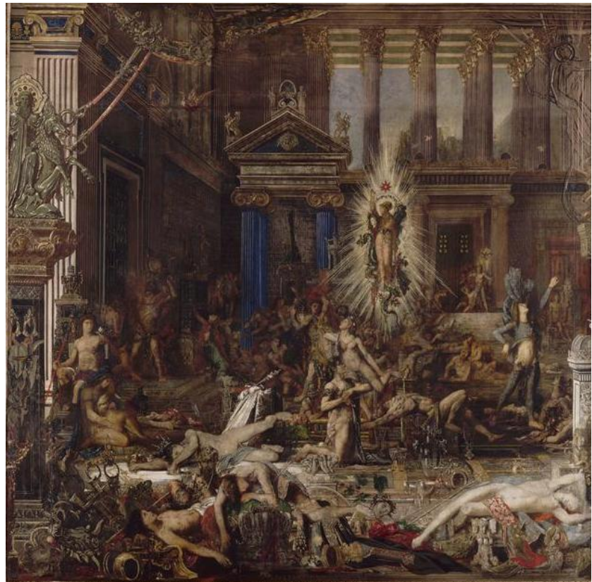
Les Prétendants Huile sur toile