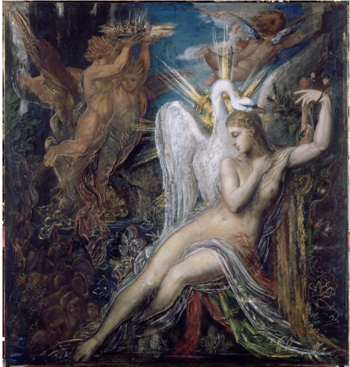
Léda et le cygne Huile sur toile