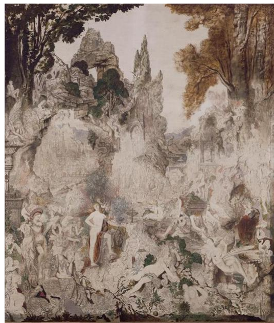
Les Chimères Huile sur toile