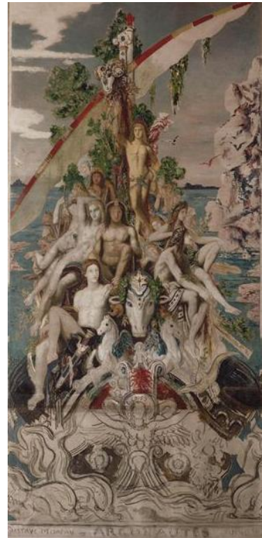
Les Argonautes Huile sur toile