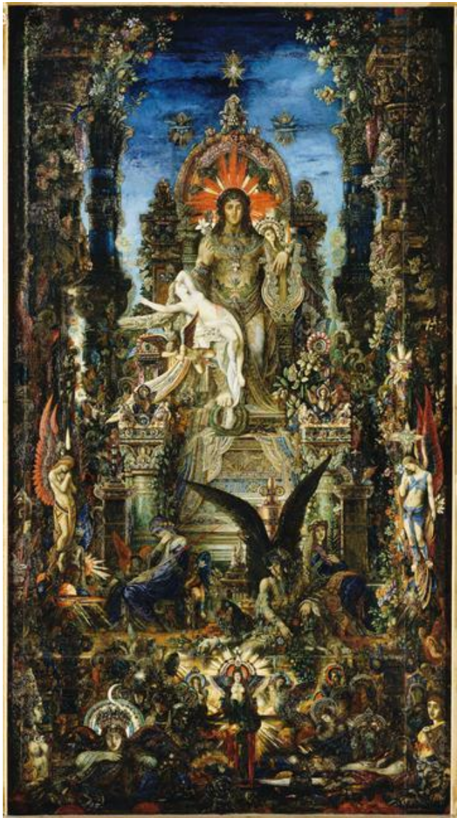
Jupiter et Sémélé Huile sur toile