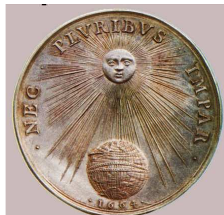
Le Roi-Soleil ( 1667)