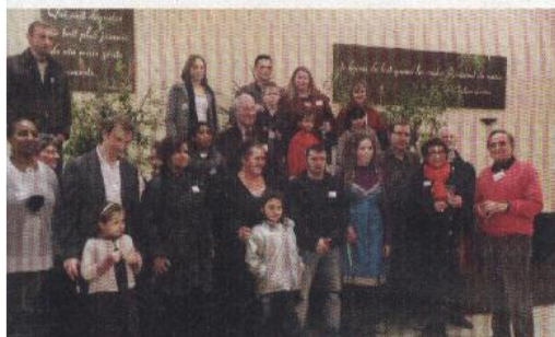
Accueil des nouveaux habitants lors de la cérémonie des vœux 2011.