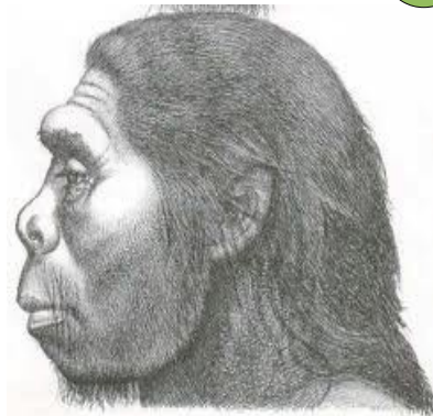
L'homme de Tautavel (Pyrénées orientales, vers 450 000 avant J.C)