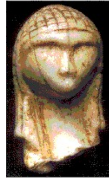
Dame de Brassempouy