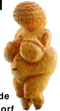
Vénus de Willendorf