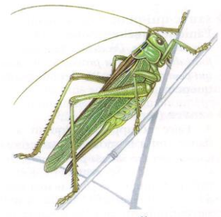
a-) sauterelle (page 1023 et 1156) 2004 2010