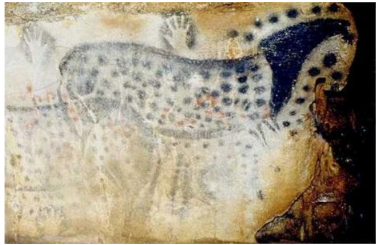
Une peinture pariétale à Pech-Merle, (Lot, - 15 000 ans )