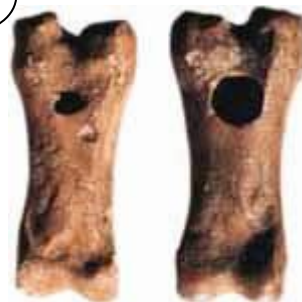
Flûtes faites en os