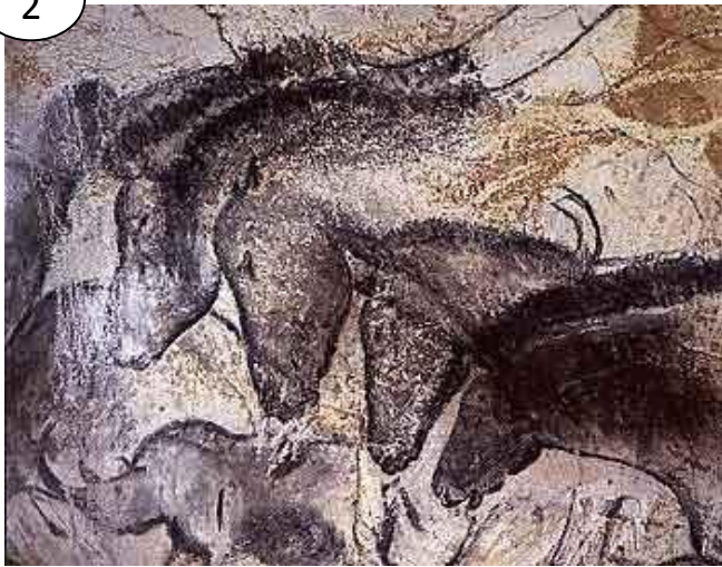
Une peinture pariétale à Chauvet (Ardèche, - 30 000)