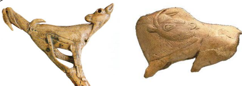
Têtes de propulseurs en bois de renne, (- 11 000 ans)