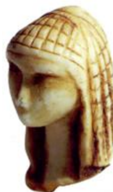
Statuette en ivoire de mammoth, Dame de Brassempouy, (-36 000 ans)