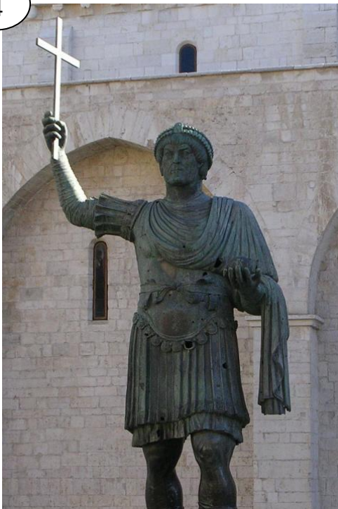
Statue de l'empereur Valentinien 1 er , 364