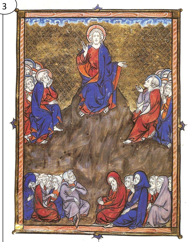
Sermon sur la montagne, manuscrit du XIIIe siècle, bibliothèque Mazarine à Paris