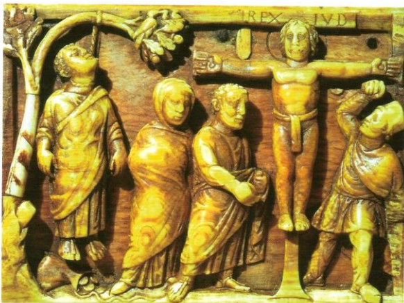
Tablette d'ivoire du Ve siècle.

4 Jésus est bientôt entouré de disciples (personnes qui suivent son enseignement). Pour eux, il est le Messie. Il est accusé par les romains de troubler l'ordre et est mis à mort sur une croix . Mais son entourage pense qu'il est ressuscité (revenu à la vie) et qu'il est monté au ciel. Ses disciples partent annoncer la « bonne nouvelle » dans l'Empire romain.