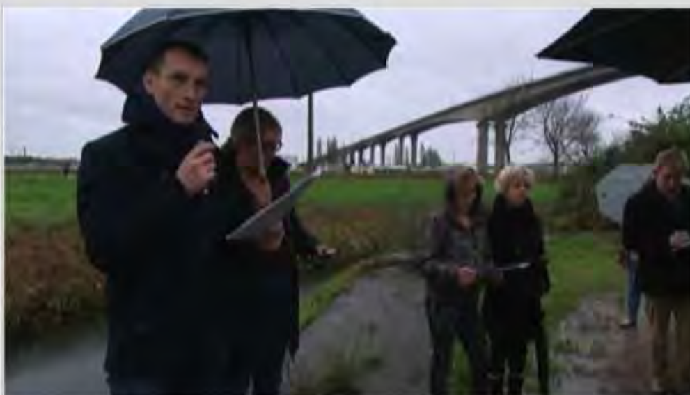
Le collectif de riverains opposé au projet a organisé une réunion informelle d'information ce samedi

Le projet de futur terminal conteneurs, quai de Calix, inquiète certains riverains