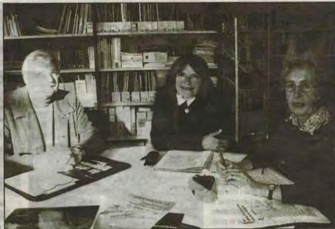
L'association Démosthène organise samedi au Pavillon de Normandie de 14h à 17h, un débat public pour discuter de l'avenir de la Presqu'île de Caen.

Le débat public du 3 décembre est gratuit et ouvert à tous, et s'inscrit dans ce projet. Il permettra de faire un cahier de préconisations qui sera diffusé en décembre. L'association précise qu'elle n'est pas sur d'être entendu mais que le maximum aura été fait pour donner la parole au groupe d'habitants qui a légitimité car il a vécu dans l'espace, et qui souhaite ainsi être reconnu à leur juste place dans la prise de décision.