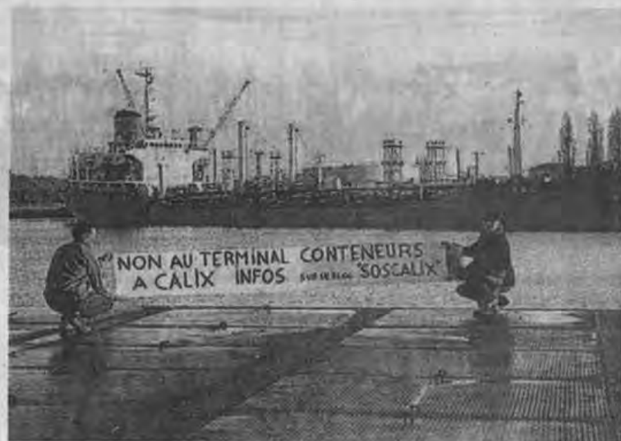
Les membres du collectif SOS Calix posent devant le mélassier « Aral » qui est arrivé dans la nuit de samedi à dimanche quai de Calix.

L'arrivée du mélassier a donné des idées aux riverains mobilisés. Dans un courrier envoyé dimanche matin, ils ont invité les « décideurs » – élus de Caen-la-Mer, Caen, Mondeville, Colombelles, Hérouville, Oulstreham, Blainville et du conseil régional, représentants de Ports normands