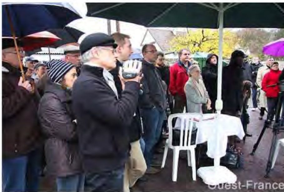
Une centaine d'habitants, riverains du canal, se sont réunis samedi matin à Hérouville-Saint-Clair.

Un débat vendredi soir en conseil d'agglomération, une réunion d'une centaine d'habitants le lendemain : le projet de plate-forme quai de Calix suscite inquiétudes et débats nourris.